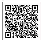
製品ページは こちらから

業界で初採用した1ch / 1電源 / 1計測回路方式のマイグレーションテスター「MIG シリーズ」で、信頼性・再現性の高い試験を提供いたします。