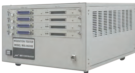
信頼性評価システム MIG-8600B

「信頼性評価システム」とは、製品の機能や動作の評価を行い、不具合を開発段階にて取り除くことで製品の信頼性を向上するためのシステムです。