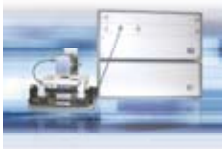
恒温恒湿対応誘電率ロガー TD-7000LF