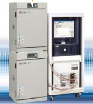
多チャンネルタイプマイグレーションテスター MIG-8600B