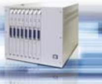
ハイサイド電流計測方式 マイグレーションテスター HSM/n