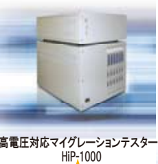
高電圧対応マイグレーションテスター HHP-1000

電子材料業界で、定評のある「1チャンネル/1電源/1計測回路」マイグレーションテスターの技術を元に、4機種をリリース