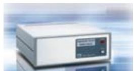
小型・軽量マイグレーションテスター Van-EE MIG-87 場所を選ばない、小型軽量タイプ