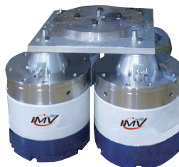
高周波多点振動試験装置