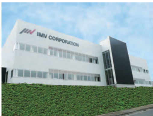
東京テストラボ 上野原サイト 高度試験センター