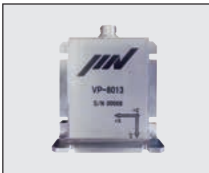
床・配管・鉄塔の評価など「コレ」はこのセンサで!