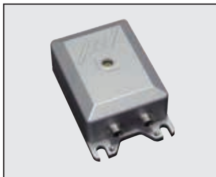
構造ヘルスマニタリングが身近になりました!