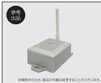
※開発中のため、製品の外觀は変更することがございます。