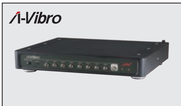
クラウド監視に必要な演算処理に!