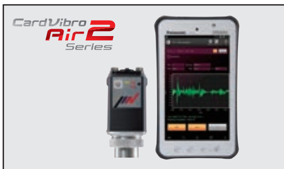
ワイヤレスでさらに便利に!