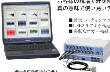
データ収録解析システム Wave Stocker