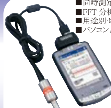
カードバイプロ Neo VM-2004 Neo (Type-2490)